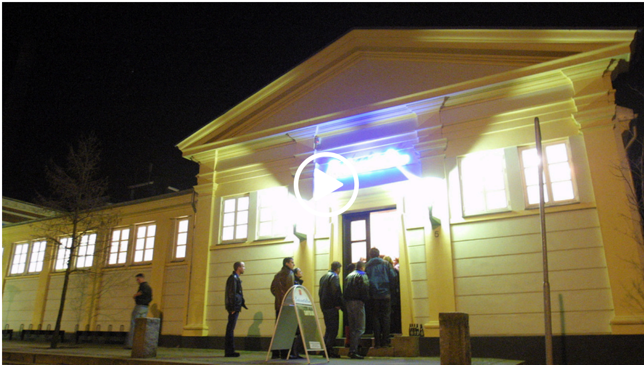
VIDEO: BESØG BADEANSTALTEN

Vi henviser desuden til Standardvilkår for Livemusikken i Danmark.